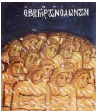
Acolo unde este "plângerea și scrâșnirea dinților". Matei 22, 13.

- Atunci spuneam că este ceva foarte frumos. Heroina este un drog foarte ciudat, care te face să nu-ți mai dorești altceva. După anumite droguri excitante (cocaină, ecstasy ), nu mai puteam dormi. Aveam insomnii. Insomnia este unul dintre simptomele cele mai rele de care se izbesc consumatorii de droguri, pentru că este îngrozitor să fii obosit și să nu poți dormi! În momentul în care îți faci heroină ești liniștit, căci heroina este un fel de antidot. În câteva luni, practic, am devenit dependentă de heroină, fiindcă nu consumam heroină doar după acele droguri excitante, ci mă injectam și cu alte ocazii. Mă injectam cu heroină și nu îmi mai trebuia nimic altceva! Stăteam liniștită, nici măcar în cluburi nu mai mergeam. Simțeam o stare de