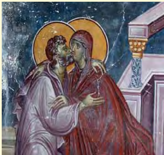
Sfinții Ioachim și Ana

Acestea auzindu-le Ioachim, s-a mîhnit și s-a dus de la biserica