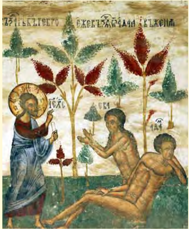
Facerea Evei - frescă, Mănăstirea Sucevița

Mai mulți dintre cititorii noștri ne-au scris de-a lungul ultimelor luni pentru a afla răspuns la unele întrebări privitoare la diferite chestiuni de credință sau la anumite probleme ivite în viața lor duhovnicească. Am întârziat până acum să răspundem acestor căutări, îndemnând la o cercetare mai atentă a duhovnicilor, căci fiecareia dintre noi Dumnezeu îi glăsuiește după nevoia sa prin cuvântul părintelui duhovnicesc pe care îl are. În anumite cazuri însă, am constatat că sfatul nostru nu este urmat, din anumite motive, și, ca atare, problemele persistă. Pentru aceasta, ne-am hotărât să răspundem la diversele întrebări care ni se pun, cu ajutorul unor părinți duhovnicești. Desigur, răspunsurile vor avea mai mult un caracter general, dar nădăjduim că vor fi de folos.