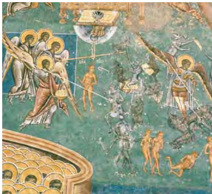
Detaliu din Judecata de apoi , Mănăstirea Voroneț

noapți petrecute în cluburi și discoteci, desfrânare și adulter, tutun, băutură și droguri. Însă când L-a cunoscut pe Hristos, s-a umplut de dragostea Lui și cu puterea primită de la Dumnezeu a ieșit la Lumină.