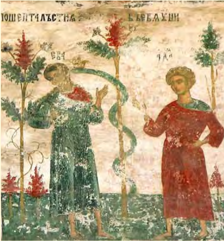
Ispitirea Evei - frescă, Mănăstirea Sucevița

nu pentru vrednicia preotului, ci pentru nevoia și sinceritatea celui care se spovedește. De aceea, dacă în mintea lui revin gânduri de sinucidere și după spovedanie, să se mărturisească încă o dată, sincer, să-și spună toate gândurile pe care le are, să-și cerceteze conștiința până ajunge la rădăcinile păcatului și să mărturisească și acele rădăcini, căci din ele se nasc gândurile cele rele. Apoi să împlinească cu credință și deplin ceea ce-i rânduieste duhovnicul în Taina Spovedaniei.