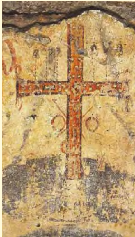
De la catacombele din Roma

– Cum vedeți raportul dintre Occident și Răsărit, raportul acesta Italia – România, din punct de vedere spiritual? Observați că acum ne confruntăm cu un război cultural, informațional. Vin peste noi avalanșele acestea de informații din Occident, ni se spune că trebuie să ne modernizăm, să intrăm în rândul lumii, al Europei, că Ortodoxia e ceva învechit... Cum priviți toate problemele acestea?