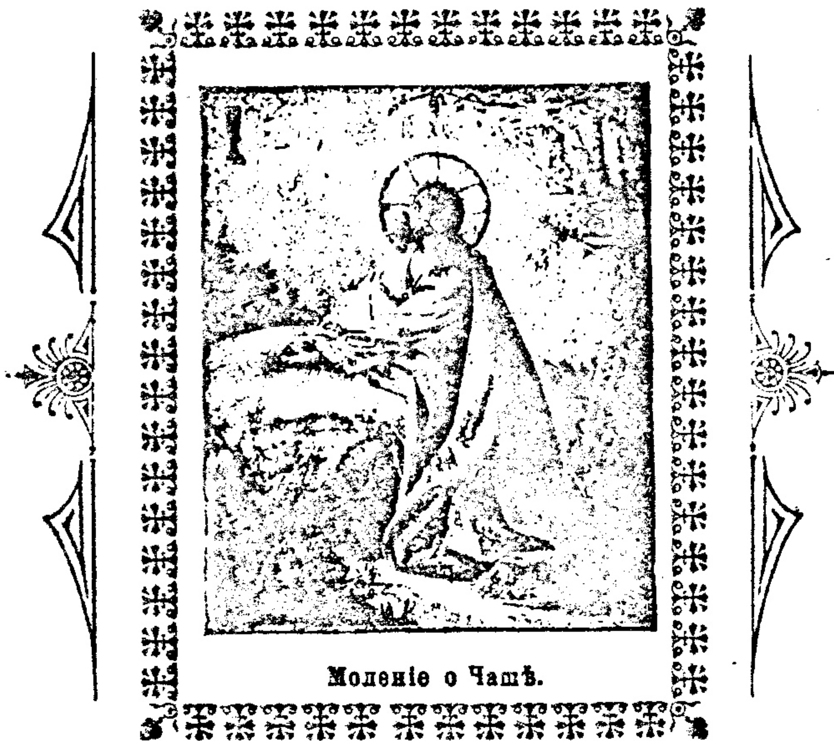
Моление о Чашѣ.