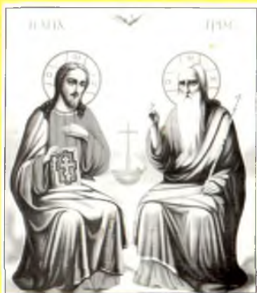
TATĂL, FIUL ȘI DUHUL SFÎNT, UNA SÎNT

EDITURA PELERINUL ROMÂN, ORADEA, ANUL 2001.