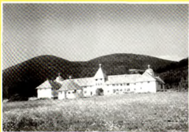
MĂNĂSTIREA "PORTĂRIȚA", sat MUJDENI, COM. ORAȘU NOU, JUD. SATU MARE, ZIDITĂ DIN CĂRȚILE EDITURII.