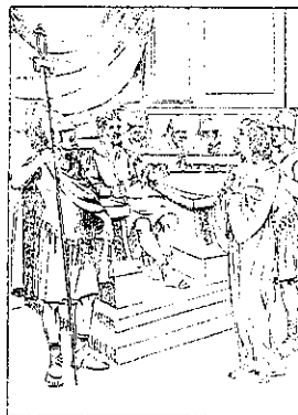
Mântuitorul în fața lui Pilat

După ce cei zece regi au terminat opera de distrugere, zice Sf. Ioan că tot în timpul acela a văzut altă fiară suindu-se de pre pământ; și avea două coarne asemenea mielului, și vorbea ca un balaur. Și toată stăpânirea fiarei celei dintâi o făcea înaintea ei, și face pământul și pre cei ce locuesc pre dânsul ca să se închine fiarei celei dintâi, a cărei rană cea de moarte s'a vindecat. Și face semne mari, ca și foc să facă să se pogoare din cer pre pământ înaintea oamenilor. Și înșală pre cei ce locuesc pre pământ, pentru semnele care i s'au dat ei să facă înaintea fiarei; zicând celor ce locuesc pre pământ, să facă chip (fotografia) fiarei care are rana sabiei, și a trăit. Și s'a dat ei a da duh chipului (fotografiei) fiarei, ca să și vorbească chipul fiarei, și să facă ca, toți câți nu se vor închina chipului fiarei, să se omoare. Și face pre toți, pre cei mici și pre cei mari, și pre cei bogăți și pre cei săraci, și pre cei slobozi, și pre cei robi, ca să le dea lor semn peste mâna lor cea dreaptă, sau peste frunțile lor. Și ca nimeni să nu poată cumpăra sau vinde, fără numai cel ce are semnul sau numele fiarei, sau numărul numelui fiarei. Aici este înțelepciunea. Cel ce are minte soco-