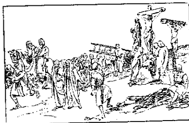
Mântuitorul pe Golgota între tâlhari

Vre-un nepriceput ar zice: Ei bine, să ascult de preoți, că Dumnezeu a poruncit așa, dar de ce mă pune să mă închin la chip cioplit? Eu întreb; la care chip cioplit? Vei zice; ne pune Preoții să ne facem semnul crucei, să o sărutăm, să ne închinăm la icoane,