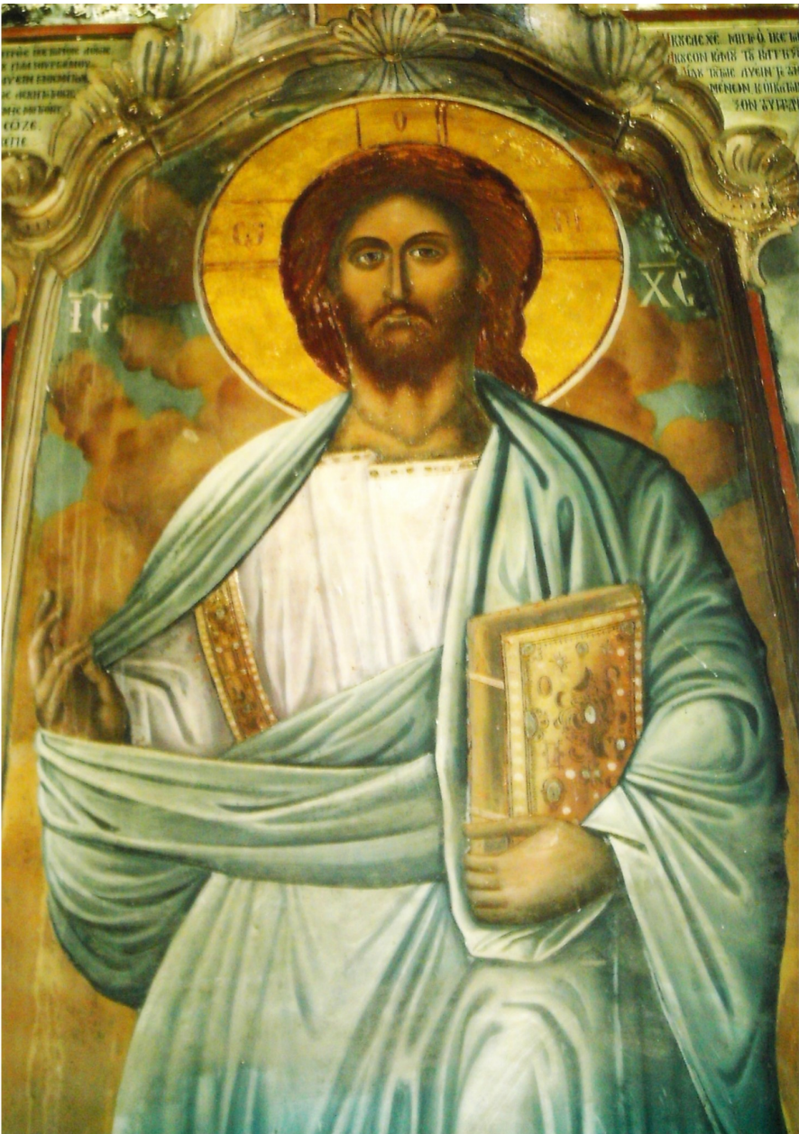
Coperta1: Sf. Cruce de pe vârful Sfântului Munte -Athos; Coperta2: Sf. Icoană a Domnului de la Sf. Mănăstire Ivron la dreapta intrării din stânga a bisericii principale.