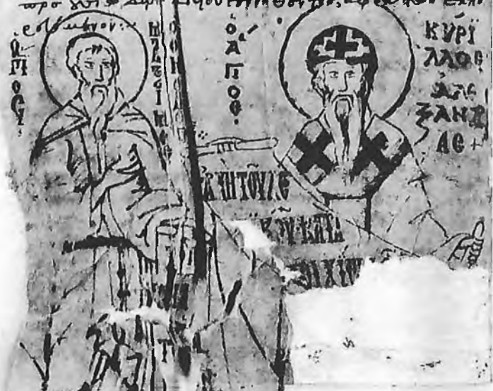
Sfântul Anastasie Sinaitul alături de Sfântul Chiril. Imagine din ms. Cutlumuș 178 , fol. 127 v

ΠΙ ΑΥΤΟΦΟ ΒΗΛΩ. ΠΡΑ ΠΟΥ ΤΟΚΕΛ ΤΟΡ. ΚΑΙ ΦΟ ΕΥ ΑΝΥ ΙΝ ΧΥ ΤΟΥ ΥΙΟΥ ΤΟΥ ΧΥ. ΤΟΝ ΜΟΝΟ ΒΗΛΩΝΗ ΘΕΤΑ ΛΙ ΕΧ ΤΟΥ ΠΡΟ ΧΕΥΩΣ ΚΑΙ ΑΙ ΔΙΩΣ. ΚΑΙ ΦΟ ΤΟ ΠΥΑ ΤΟ ΑΤΙ ΤΟ ΧΥ ΕΙΔ. ΤΟ ΕΙΩΣΠ. ΤΟ ΕΧ ΤΟΥ ΠΡΟ. ΔΙΟΥ ΕΙ ΠΟ ΕΛΘΕΙ. ΚΑΙ ΑΥ ΤΟ ΥΝΟΥ ΕΙ ΚΑΙ Ρ ΕΙΔΕΜΕ. ΤΕΙ ΑΔΩ ΟΥΧ ΕΧΤΙ ΟΥ ΤΕ ΚΑΙ ΟΜΟΤΙ ΜΟΝ. ΚΑΙ ΟΜΟΘΡΟΝΗ ΑΙ ΔΙΟΥ. ΑΚΤΙ ΣΟΙ. ΟΥ ΠΑΝΤΙ ΚΤΙ ΤΩΝ. ΑΛΛΕ ΟΥ ΤΟΙ. ΜΕ ΔΕΧΕΙ. ΜΕΓΑΛΟΤΑΤΑ ΚΑΙ ΗΥ ΕΙ ΟΤΑΤΑ. ΜΕ ΒΑΣΙΛΕΥΑ ΚΑΙ ΔΙΩΑΜΕ Η. ΚΑΙ ΟΥ ΤΙ ΑΥ ΒΙ ΤΕΙ ΔΥΝΑΤΟΤΑΤΟΝ. ΑΔΙ ΤΡΕΙΣ ΟΙ ΔΙΩΑ ΕΥ ΜΗ ΚΑΙ ΟΥ ΜΕΛΛΑ ΜΑΡ ΒΗΩ. ΜΑΘΕ ΖΗΤΕ ΧΩΙ ΤΕΙΩΝ ΒΙ ΤΕ ΛΦΟΙ. ΒΗ ΤΟΠΟ ΤΑΛΟ ΚΑΙ ΤΕ ΤΕ ΛΦΟΝ. ΦΟ ΟΙ ΜΕΛΛΑ ΕΦΑ ΔΙΟΥ ΟΥ ΤΙ ΣΟ. Ο Ο ΤΑ ΧΥ ΑΙ ΤΩ ΜΕΙ ΟΤΑΤΑ ΦΟ ΠΕΡΩ ΠΩΝ. ΤΕΙ ΤΑ ΠΕΡ ΟΜΕ ΜΕ. ΙΠΠΙ ΔΕ ΤΟ ΜΕ ΤΟ ΦΥΣΙ ΣΟ. ΦΟ ΟΥ ΤΑΤΑ ΑΙ ΜΑ ΤΟ ΠΙ ΠΥΑ ΤΟ ΑΤΙ. ΟΥ ΤΑ ΦΥΣΙ ΜΠΟΥ ΟΥ ΑΥ ΤΟΠΟ ΧΥ ΤΟΥ ΘΥ ΚΑΙ ΤΟΡΟ. ΟΥ ΠΟ ΤΟ ΤΟΥ ΥΙΟΥ ΧΥΟΥ ΟΥ ΔΙΟΥ. Ο Ο ΘΑ ΤΟΥ ΠΡΟ ΧΥ ΤΟ ΔΙΟΥ ΜΙΟΥ ΟΥ ΜΗ ΘΕΤΑ ΤΕ. ΑΦ ΕΛΘΕΝ ΕΧΠΟ ΕΙΔΕΜΕΝΟΝ.