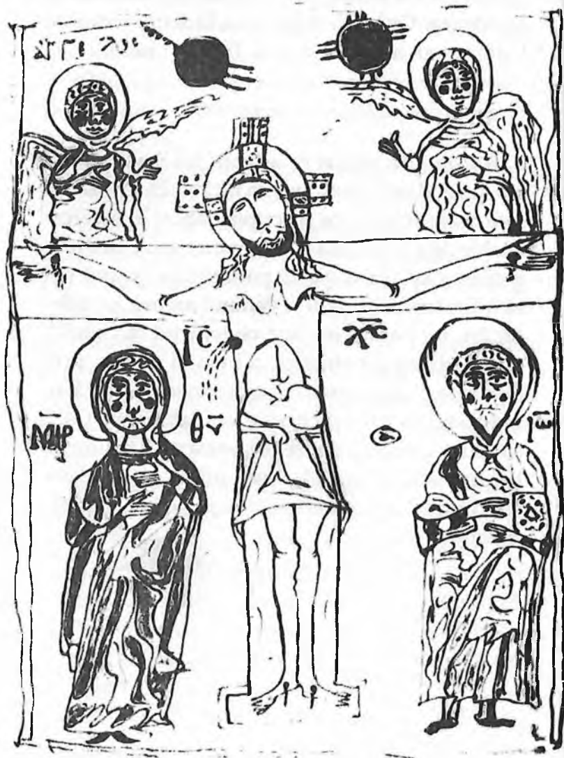
Imagine din ms. Lavra 131 (B II), fol. 91 v , unul dintre cele mai vechi manuscrite ale Căluzei (sec. X), care nu a fost folosit în ediția critică a lui K.-H. Uthemann, CCSG 8 (Turnhout, 1981).